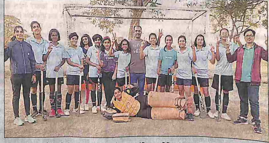
राज्यस्तरीय स्पर्धेसाठी निवड झालेला अनेकान्त इंग्लिश मीडियम स्कूलचा संघ.